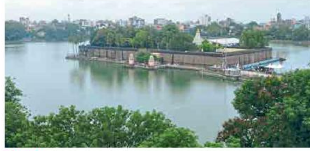
सोलापूर : संततधार पावसामुळे सिद्धेश्वर तलाव तुडुंब भरला आहे. तसेच पावसामुळे झाडे-झुडूपे हिरवीगार झाल्यामुळे मंदिर परिसर खूब सुखून दिसत आहे.

झाला आहे. सूत्रांच्या म्हणण्यानुसार, राज्यात एक जून ते ३१ ऑक्टोबरदरम्यान सरासरी १०७५ मिलिमीटर पाऊस होतो. त्यापैकी २०८ मिलिमीटर जूनमध्ये; तर जुलैत ३३२ मिलिमीटर पाऊस होतो. यंदा मॉन्सूनची वाटचाल दमदार सुरु आहे. त्यामुळे वर्षभराच्या सरासरीपैकी ६१९ मिलिमीटर म्हणजेच ५२ टक्के पाऊस गेल्या ५२ दिवसांमध्ये झालेला आहे.